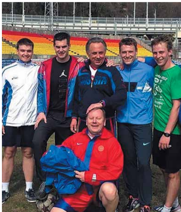
С Виталием МУТКО после игры в футбол

причин клуб закрылся, а так как он работал на базе УГТУ-УПИ, я перешел на должность старшего преподавателя кафедры физической культуры этого вуза, на которой работаю по сей день. Сейчас уже, правда, тружусь там только на четверть ставки, так как с 2011 года являюсь еще и тренером сборной команды России по легкой атлетике, где на меня возложен большой объем очень хлопотной административной и организаторской работы по проведению сборов.