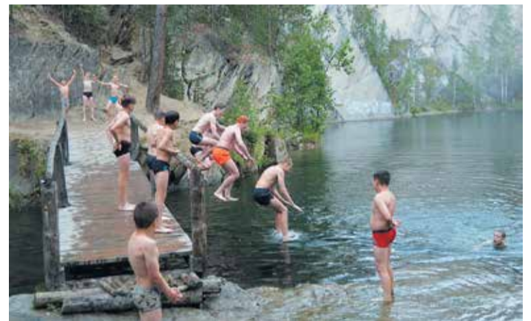
Поход на Тальков камень

надо иметь, дома регулярно холодный душ принимать, а сейчас большинство родителей к такому ребят не приучают. Ведь сегодня дети все чаще растут в неполных семьях, воспитываются мамами, бабушками, а в школе — учительницами. Это — проблема нашего общества, потому что без мужского участия невозможно вырастить настоящего мужчину. А мой девиз: «Настоящий мужчина все может, все знает, все умеет и ничего не боится!». Поэтому мои воспитанники, которых у нас называют «козлятами», выделяются на фоне своих ровесников. Они трудолюбивы, терпеливы, настойчивы в достижении поставленных целей и умеют за себя постоять.