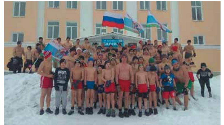
Новогодний забег 31 декабря 2019 года

— В снятом о вас три года назад фильме «Батя» есть эпизоды о ваших многокилометровых походах с ребятами на природу, о зимних кроссах в одних шортах от стадиона «Уралмаш» до площади Первой пятилетки и обрат-