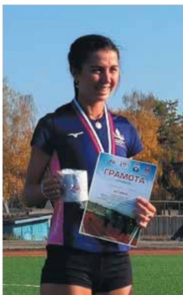
Победительница чемпионата России 2022 года по горному бегу Мария БЕРЕЖНАЯ