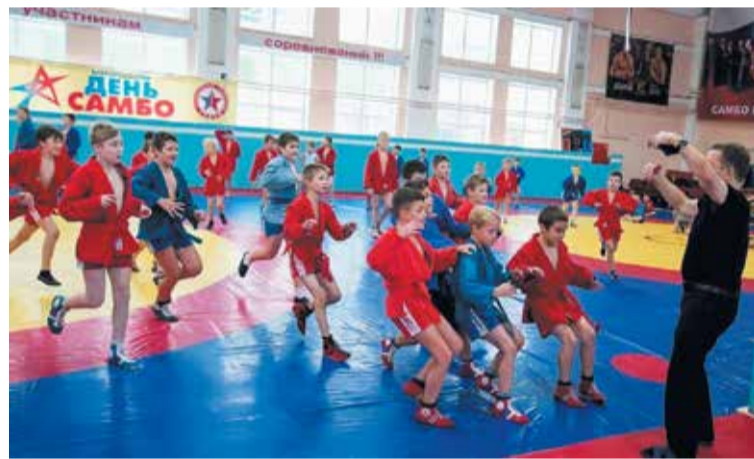
Момент тренировки. Тренер зовет ребят

ского неуживчивого характера мне за несколько лет пришлось сменить несколько мест работы. Потому что не мог мириться даже с мелкими, как говорили во времена СССР, злоупотреблениями, которые начальники допускали вроде бы из благих побуждений, чтобы были хорошие показатели в выполнении планов и распоряжений еще более высокого начальства. А когда меня уволили с очередного, уже четвертого места работы, старший брат и посоветовал мне вспомнить полученные еще в школе спортивные знания, умения и навыки и попробовать себя на тренерской работе в спортклубе «Уралмаш». Я рискнул, а когда начал работать с мальчишками тренером по самбо, быстро полюбил это дело и понял, что это — и есть мое настоящее призвание. На этом месте, в этой должности работаю уже 40 лет. Только теперь это — уже спортшкола олимпийского резерва по самбо и дзюдо. Прошел переподготовку в РГППУ по курсу «Организационно-педагогиче-