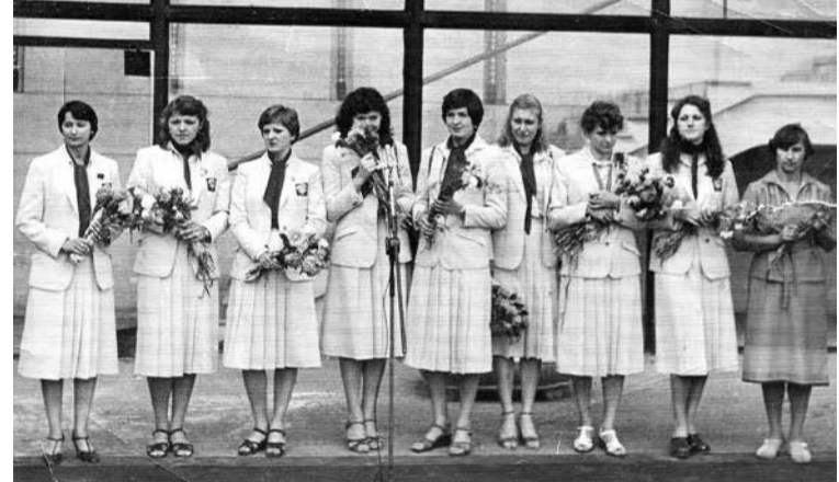
Сборная возвращается с Олимпийских игр Москва-80. Аэропорт Кольцово

— Сильно изменились игроки. Стали высокими, атлетичными, мощными. У меня рост 177 см. Сей-