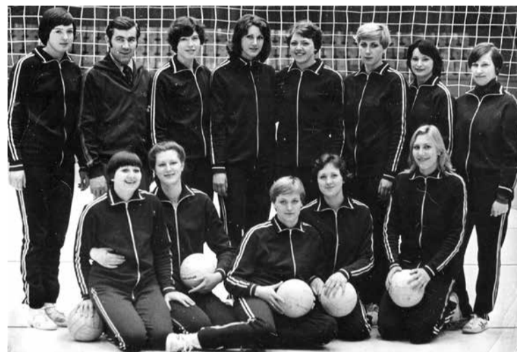
«Уралочка» — впервые чемпионы страны в 1978 году

— А как же преданность клубу? Вы в «Уралочке» 11 сезонов