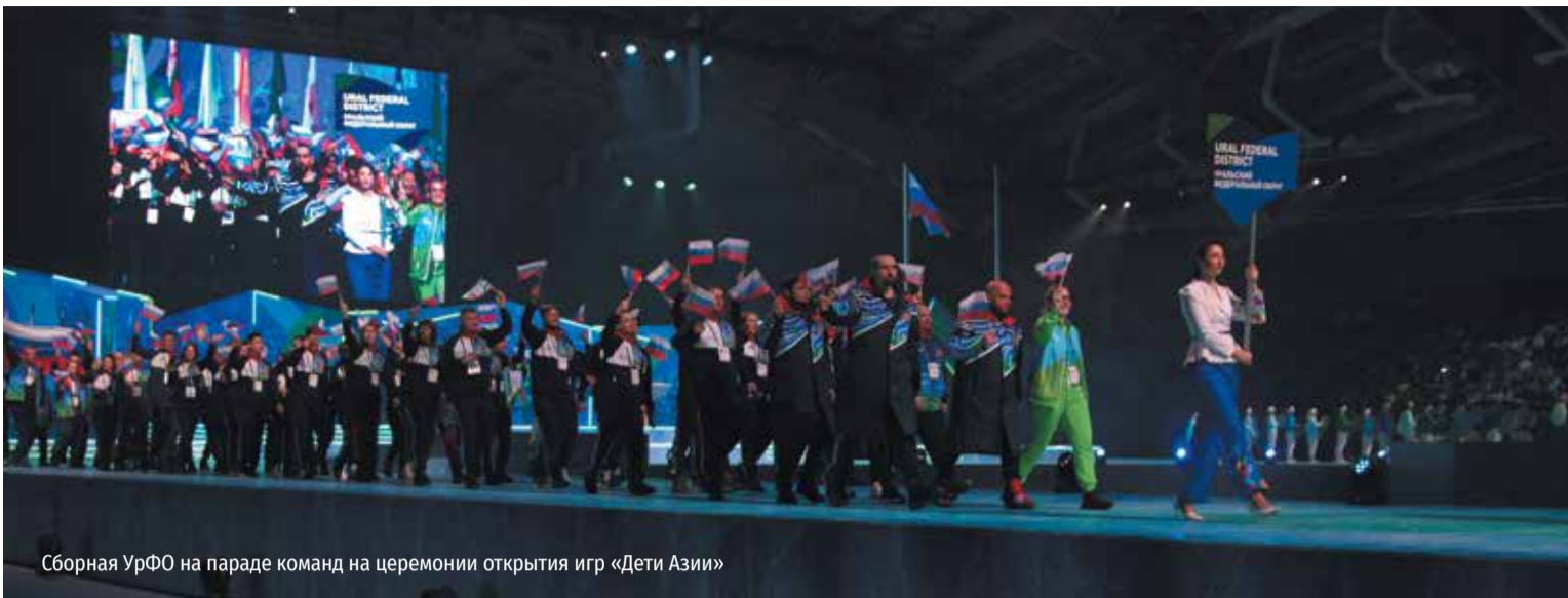
Сборная УрФО на параде команд на церемонии открытия игр «Дети Азии»