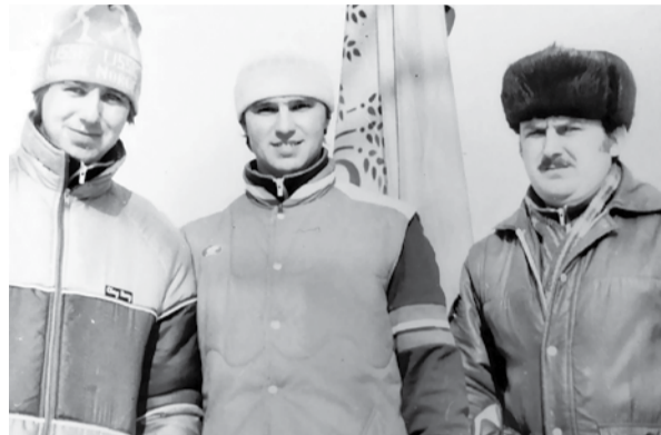
Москва, стадион «Динамо». 1978 г. В центре — Анатолий МЕДЕННИКОВ трехкратный чемпион СССР МСМК участник Олимпийских игр в Лейк-Плэсиде (США).

дителем юниорского первенства, обыгрывал взрослых мужиков. В 1981 году стал третьим на чемпионате мира в спринтерском многоборье.