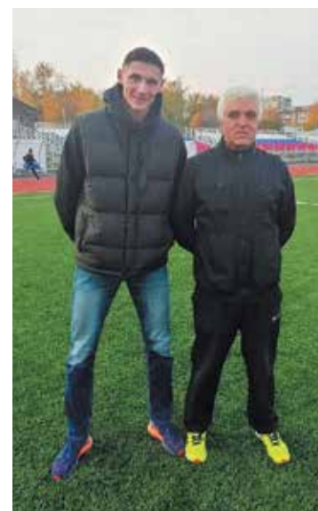
Чемпион Европы Павел ТРЕНИХИН