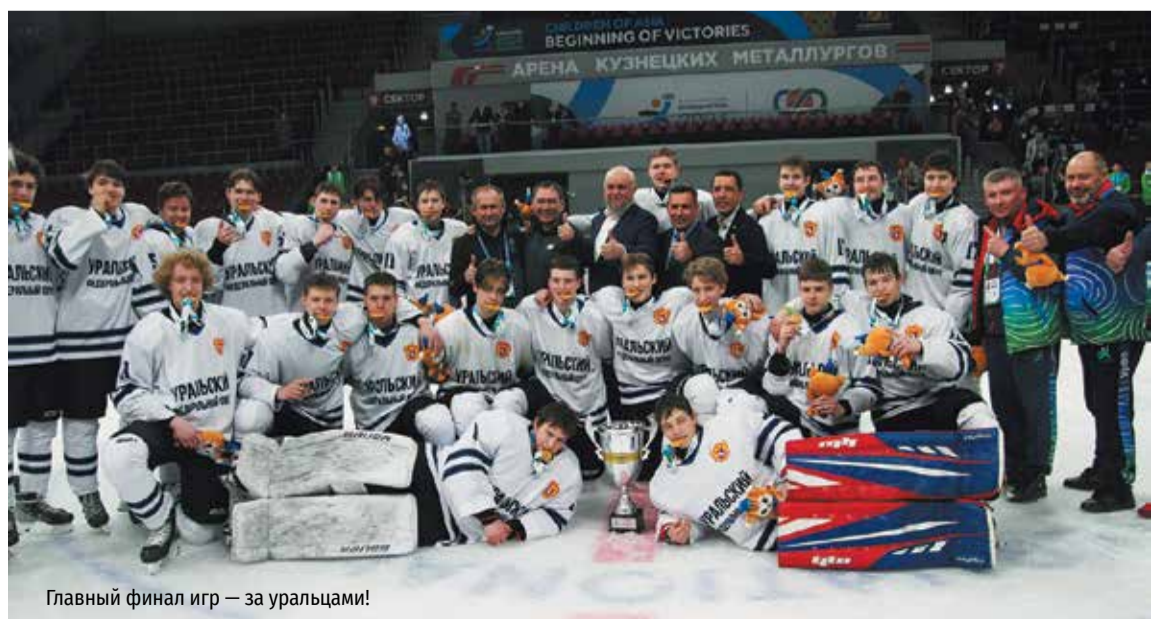
Главный финал игр — за уральцами!